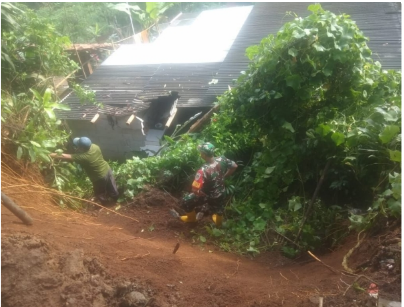
Babinsa Koramil 0622-04/Cikidang Cek Longsor di Wilayah Desa Pangkalan Kecamatan Cikidang Kabupaten Sukabumi

Sukabumi - Babinsa Desa Pangkalan bersama Pemerintah Desa, Babinkamtibmas, dibantu warga setempat telah mengecek lokasi tanah longsor